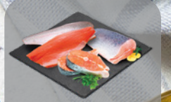
Atvėsinta atlantinių lašišų filė