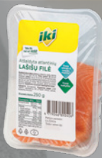
Atvėsinta atlantinių lašišų filė IKI