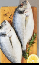
Atvėsintos auksaspalvės dorados