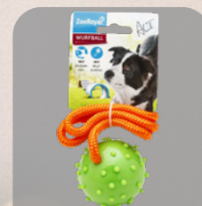
ZOOROYAL žaislas virvė su kamuoliu

MŪSŲ PARDUOTUVĖSE VISADA RASITE ŠIO TO IR SAVO AUGINTINIUI. ČIA JŪSŲ LAUKIA PLATUS MAISTO, ĮVAIRIŲ SKANUKŲ IR, ŽINOMA, NUOBODŽIAUTI NELEIDŽIANČIŲ ŽAISLŲ PASIRINKIMAS.