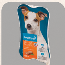
ZOOROYAL visavertis šunų pašaras su vištiena ir širdimis