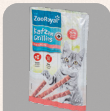
ZOOROYAL kačių pašaro papildas su lašiša