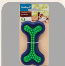
ZOOROYAL žaislas guminis kramtalas dantų priežiūrai