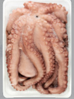
Atitirpinti didžiojo skraidkalmario čiuptuvai