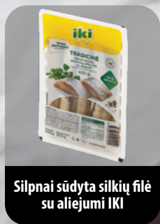
Silpnai sūdyta silkė su aliejumi IKI

Iš silkės pašalinkite visus kaulus ir jau švarią žuvies mėsą smulkiai supjaustykite. Dėkite į dubenėlį. Ten pat sudėkite garstyčias, labai smulkiai supjaustytą svogūną, smulkiai sukaptus petražolių lapelius ir krapus. Viską gerai išmaišykite. Į dubenį dėkite aviečių uogienės ir vėl išmaišykite. Jei trūksta skonio – dėkite arba druskos arba dar šaukštelį aviečių uogienės. Kapotinis paruoštas – galite ragauti!